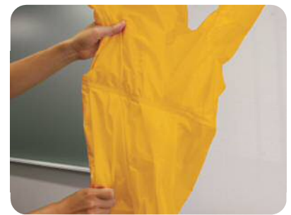
③ 開口部を密封完了。