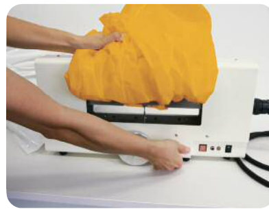
② フィルムの開口部をクリーンパックIIに通し溶着開始。